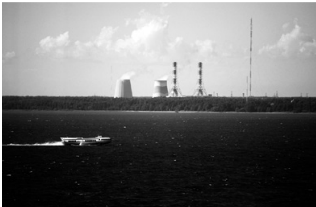
Russische energiecentrale; de lidstaten van de EAEU profiteren van goedkope Russische energie.

Wat betreft energieveiligheid streeft de EU er naar energie uit diverse landen te importeren, om zodoende onafhankelijker van Rusland te worden. De EAEU zou wel eens stokken in de wielen van dit diversifiëringsbeleid kunnen steken. Aangezien de lidstaten van de EAEU zich tevens ten doel stellen de energiemarkten (olie, aardgas, elektriciteit) te integreren, is het maar de vraag in hoeverre Kazachstan als alternatieve energieproducent kan worden beschouwd.